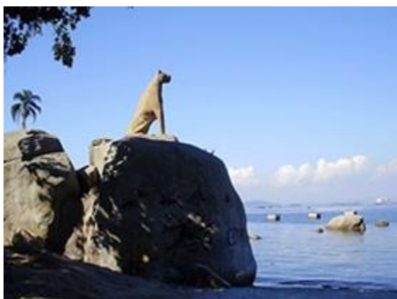
Pedra da Onça. Disponível em: < http://www.ilhacarioca.com.br/a-lenda-da-pedra-da-onca/ > Acesso em 10 de outubro 2012.