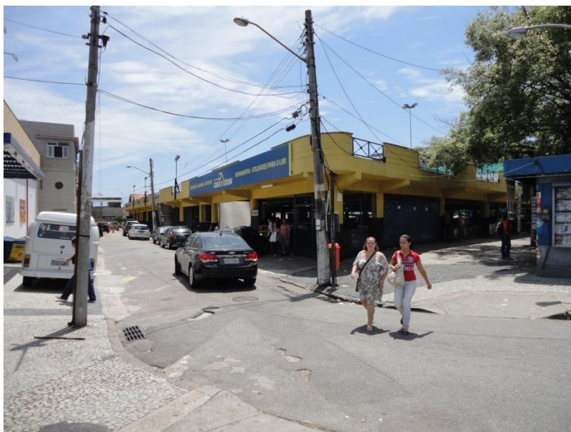
Foto do possível local onde será construído o centro cultural, na Estrada do Galeão.