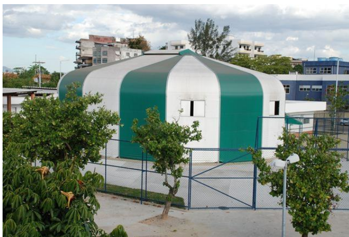
Lona Cultural Renato Russo. Disponível em: < http://lcrenatorusso.wix.com/lcrenatorusso > Acesso em 10 de outubro 2012.