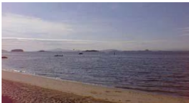
Praia da Freguesia. Disponível em: < http://www.superilha.com.br/ilha/ilha.htm > Acesso em 05 de abril 2012.