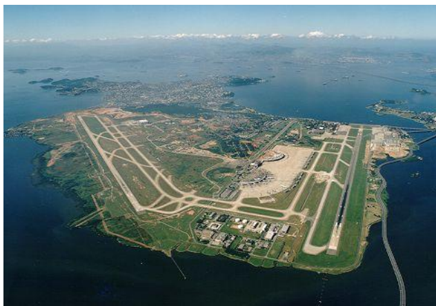
Ilha do Governador.